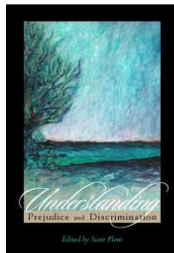
ההבנה של דעות קדומות ואפליה

מאמר זה מעובד מתוך ס. פלאוס (2003). הפסיכולוגיה של דעות קדומות, שימוש בסטריאוטיפים ואפליה: סקירה כוללת. בתוך ס. פלאוס (עורך), ההבנה של דעות קדומות ואפליה (עמ' 3-48). ניו-יורק: מקגראו-היל.